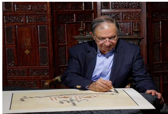
ハマユン・カーン・バンガシュ氏

トルコ、マケドニアにてパキスタン大使を歴任。70歳を過ぎた頃から書道への才能と情熱を発揮し、パキスタンの伝統美術協会に入会。わずか2年で国際的な協議会の出展作品に選ばれ、イスラム諸国の著名な書道作家から高い評価を得る。初期の成功を励みに、その後も数々のユニークな作品を制作し、幅広い評価を得る。現在、パキスタン書道協会会長を務める。